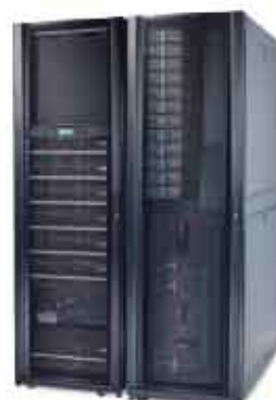
带电源分配的Symmetra PX 96