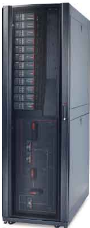
160kW 模块化电源分配单元

APC独特设计的模块化电源分配无需高温作业或计划性停机便可实现电源分配系统的安全扩展。APC Symmetra PX 96/160kW配置模块化电源分配可大大增强供电系统的升级能力。