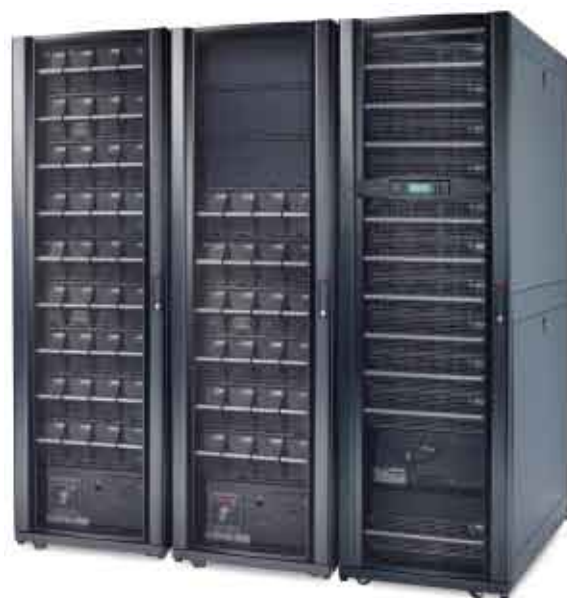
Symmetra PX 160kW

Symmetra PX 96/160kW可完美集成到当今最先进的数据中心设计中，是真正的模块化系统，由可热拔插的功率模块、智能模块、电池模块、旁路和电源分配组成，该体系结构可根据您的数据中心增长或更高可用性等级的需求，在16kW到160kW之间对功率和运行时间进行扩展，自诊断功能增强了Symmetra PX 96/160kW的可管理性，并提高了数据中心的整体可靠性。