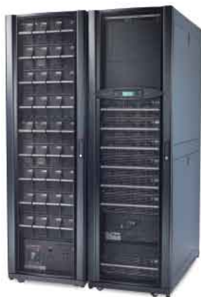
Symmetra PX 96kW

作为APC InfraStruXure ® 系统的核心电源系统，Symmetra PX系列适用于高效管理的小型、中型及大型数据中心，其设计可大大缓解由于增长造成的数据中心空间紧缺。标准化、工厂组装测试的模块大大降低了人为错误。无需后部访问，Symmetra PX 96/160kW可直接置于数据中心地板上、安装于设备间或靠墙摆放。