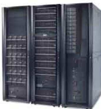
带电源分配的Symmetra PX 160